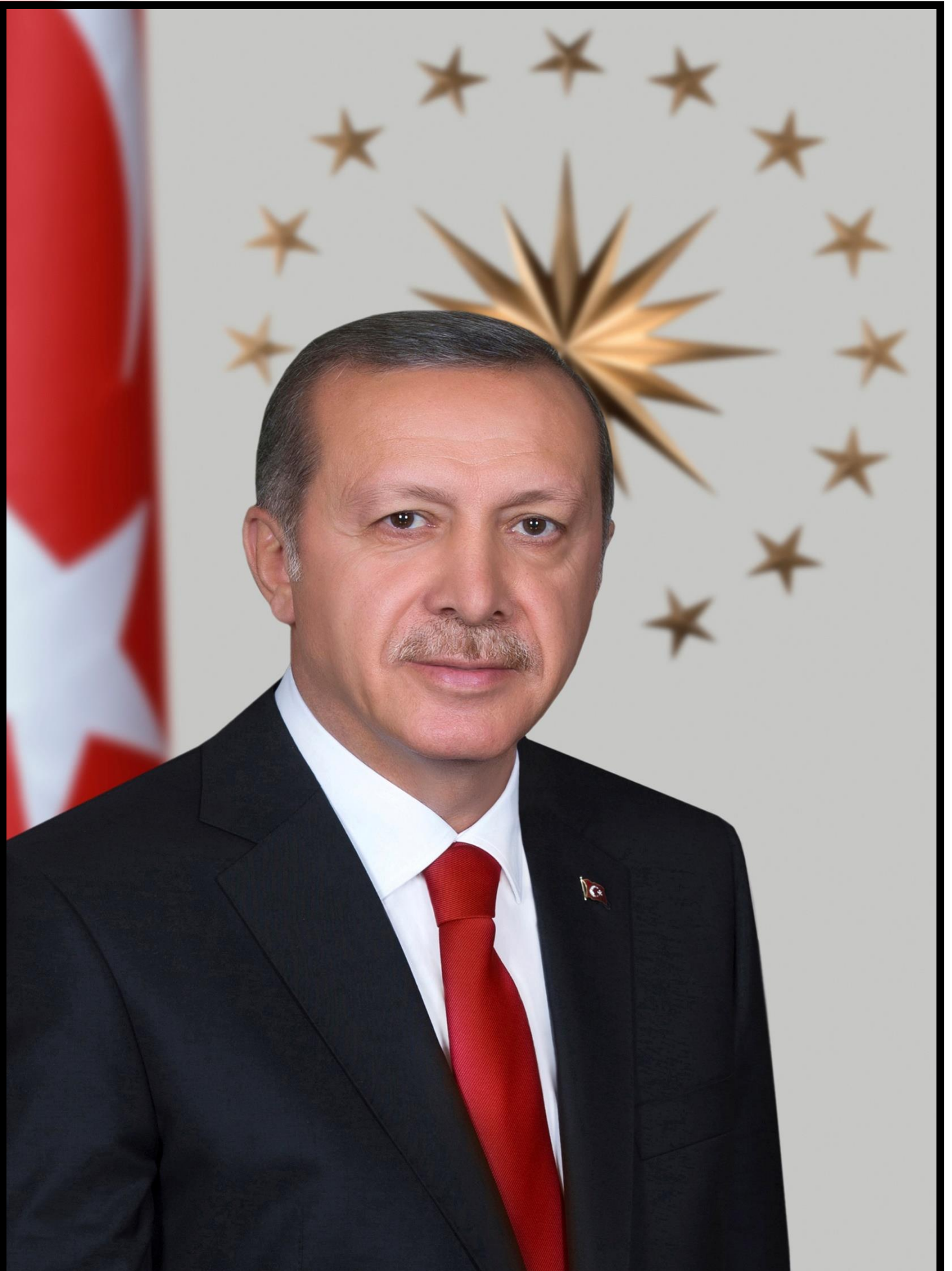
TÜRKİYE CUMHURİYETİ BAŞKANI RECEP TAYYİP ERDOĞAN