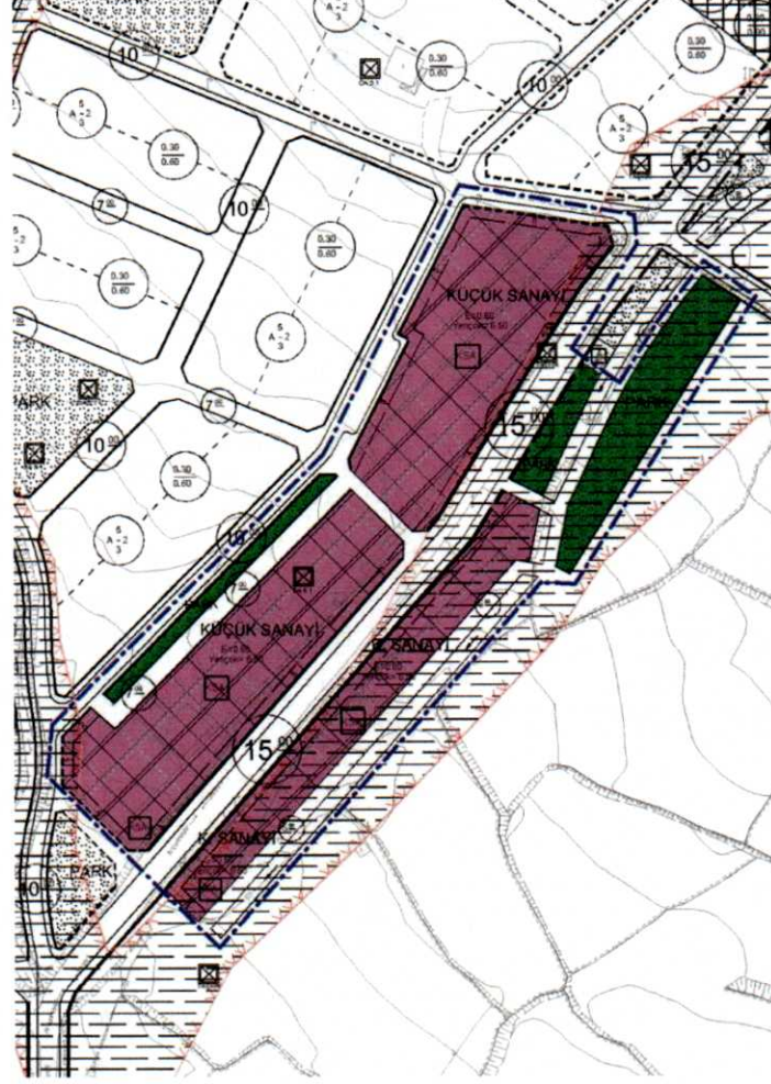
Resim 7: Öneri 1/1000 Uygulama İmar Planı Değişikliği

İmar planı değişikliği 3194 sayılı İmar Kanunu ve İlgili Yönetmelikleri çerçevesinde ilgisinin isteği üzerine tarafımdan hazırlanmıştır.