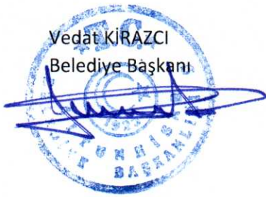
Vedat KİRAZCI Belediye Başkanı

'5393 Sayılı Belediye Kanunu'nun 18'nci maddesinin "e" bendi gereğince Karaman Camii önünde bulunan Saray sokak yolunun genişletilmesi için 4182 parsel sayılı "kargir ev ve arsası" vasfındaki taşınmaz Sağlık Mahallesi Haştır Mevkiinde 281 ada üzerinde yer alan mülkiyeti Belediyemize ait 3 adet arsa ile takas edilmesine, takas öncesi taşınmaz varislerinin noter tasdikli vekaletlerinin bir veya bir kaç kişiye verilmesi ve tüm hissedarların imza atması kaydı ile ve yine takas karşılığı 4182 parsel de bulunan hissedarların hisseleri oranında takas işleminin 25.02.2022 tarihinden önce gerçekleştirilmesine, her türlü vergi ve harcın varisler tarafından karşılanması görüşülerek açık oylamaya sunuldu, yapılan açık oylama neticesinde oy birliği ile kabul edildi.